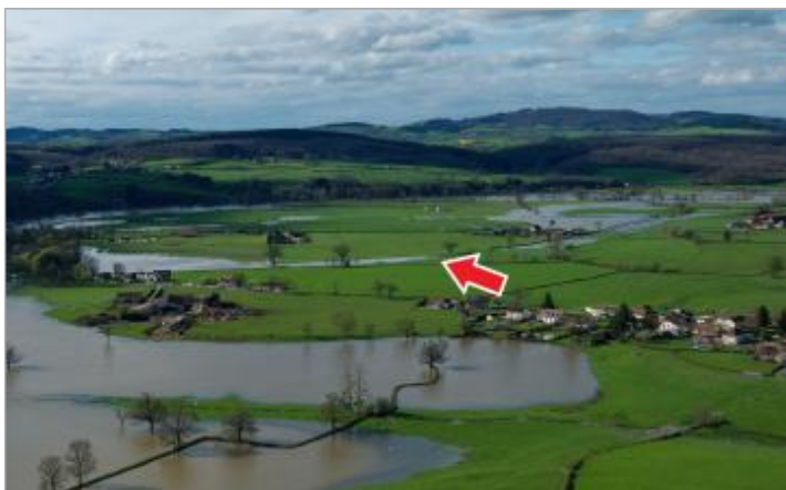
Photo prise pendant l'événement, le 02/04/2024, à 17h14.