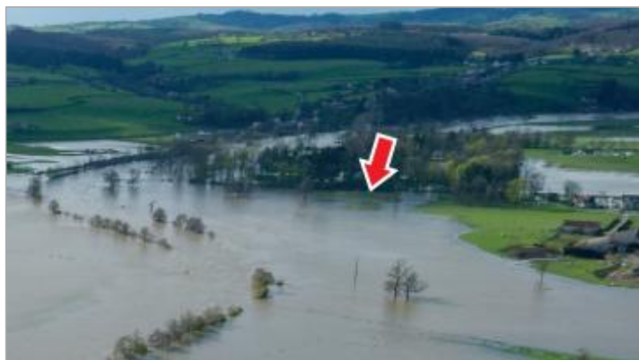
Photo prise pendant l'événement, le 02/04/2024, à 17h14.