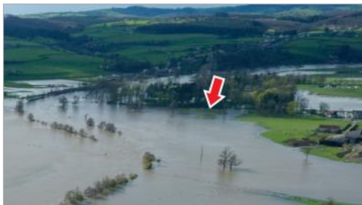
Photo prise pendant l'événement, le 02/04/2024, à 17h14.