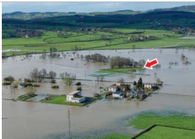
Photo prise pendant l'événement, le 02/04/2024, à 17h18.

Altitude calculée de l'eau (en m) : 243.8