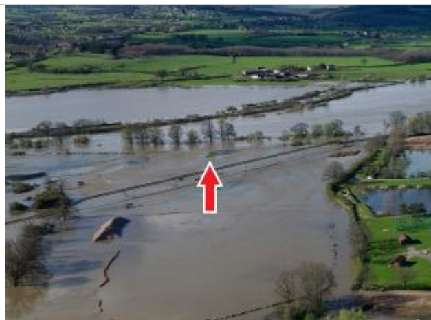
Photo prise pendant l'événement, le 02/04/2024, à 17h33.