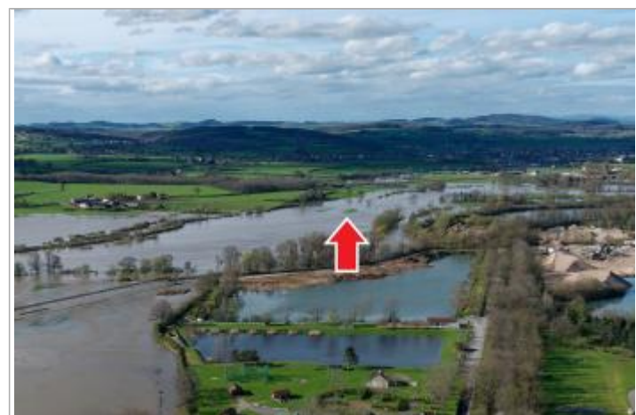
Photo prise pendant l'événement, le 02/04/2024, à 17h33.