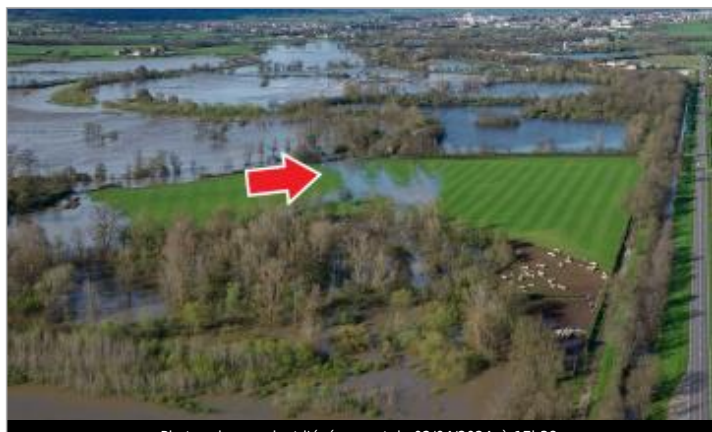
Photo prise pendant l'événement, le 02/04/2024, à 17h38.