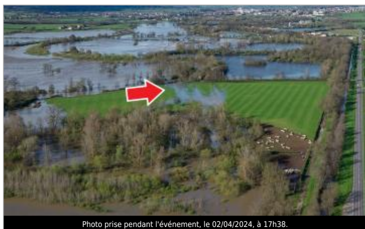
Photo prise pendant l'événement, le 02/04/2024, à 17h38.