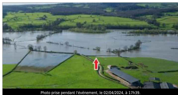
Photo prise pendant l'événement, le 02/04/2024, à 17h39.