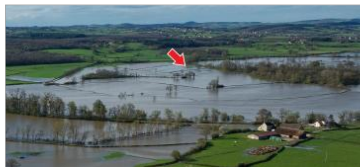
Photo prise pendant l'événement, le 02/04/2024, à 17h39.