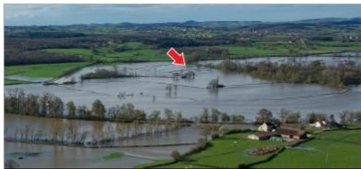
Photo prise pendant l'événement, le 02/04/2024, à 17h39.