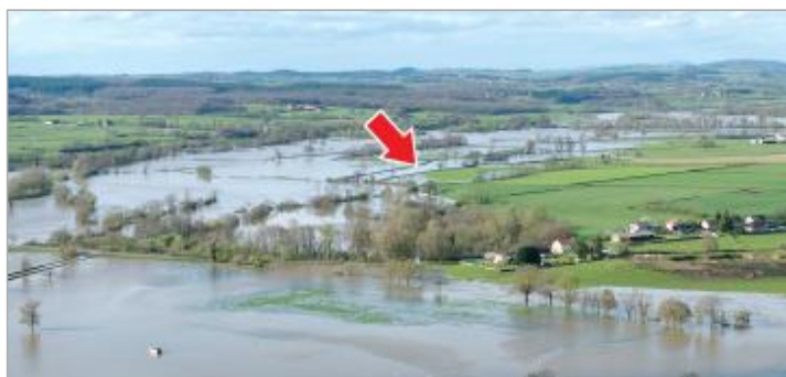
Photo prise pendant l'événement, le 02/04/2024, à 17h52.