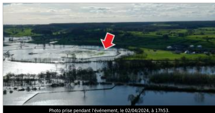
Photo prise pendant l'événement, le 02/04/2024, à 17h53.