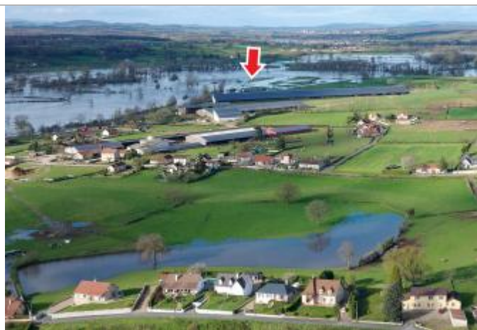
Photo prise pendant l'événement, le 02/04/2024, à 18h05.

Altitude calculée de l'eau (en m) : 229.8