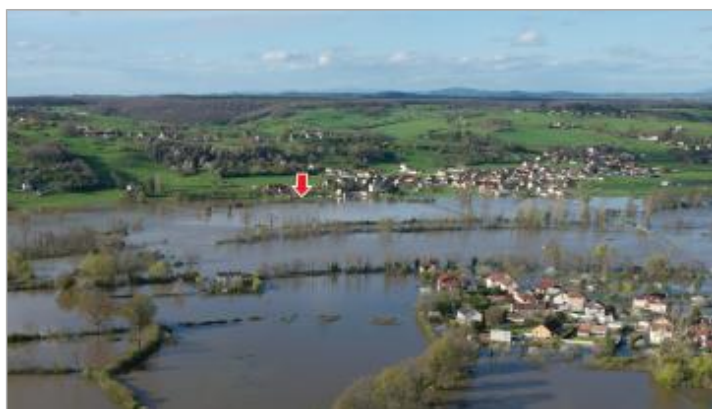
Photo prise pendant l'événement, le 02/04/2024, à 18h15.