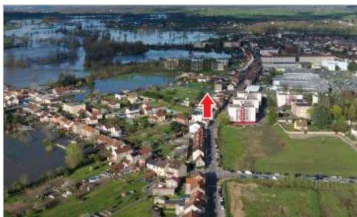
Photo prise pendant l'événement, le 02/04/2024, à 18h15.