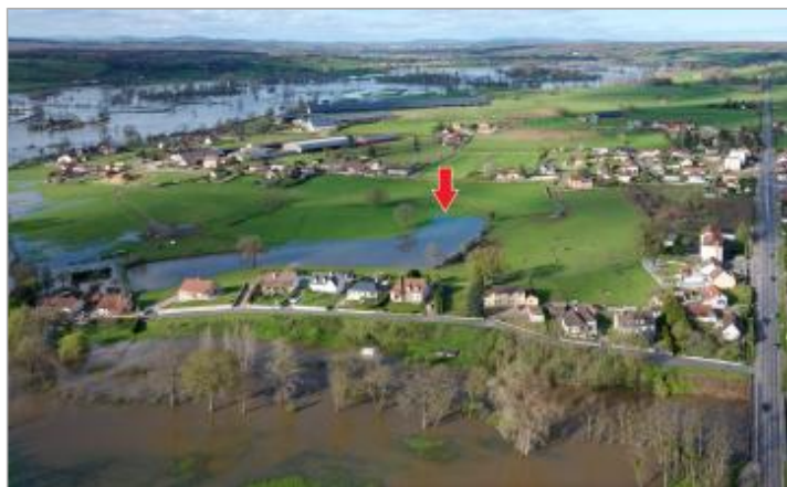
Photo prise pendant l'événement, le 02/04/2024, à 18h05.