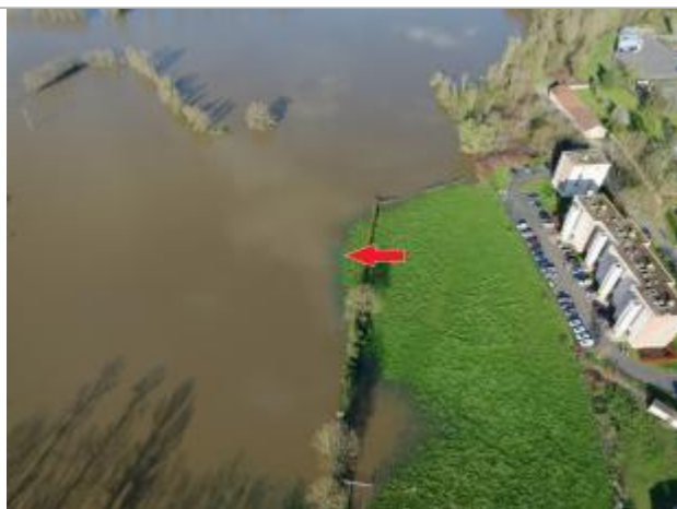
Photo prise pendant l'événement, le 02/04/2024, à 18h23.

Altitude calculée de l'eau (en m) : 227.2