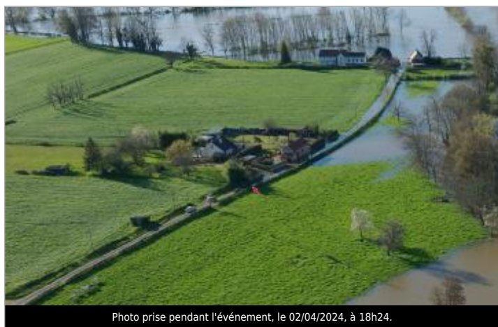
Photo prise pendant l'événement, le 02/04/2024, à 18h24.