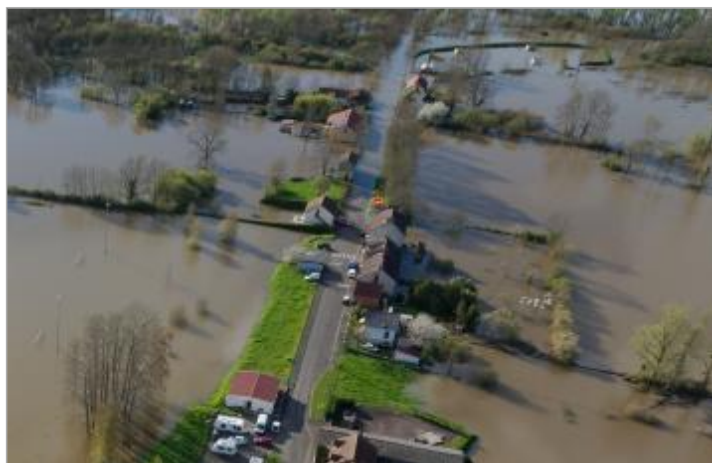
Photo prise pendant l'événement, le 02/04/2024, à 18h15.