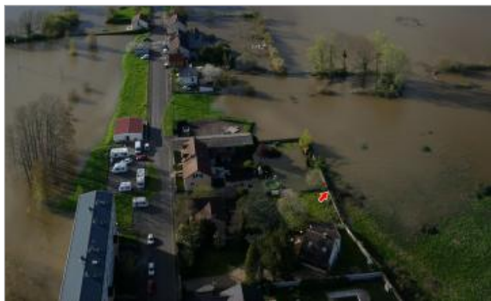
Photo prise pendant l'événement, le 02/04/2024, à 18h15.