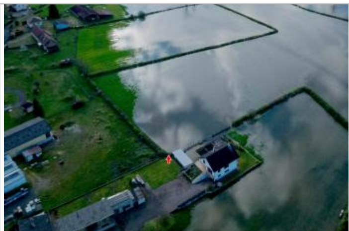
Photo prise pendant l'événement, le 02/04/2024, à 18h06.

Altitude calculée de l'eau (en m) : 228.5