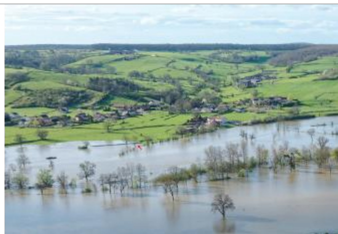
Photo prise pendant l'événement, le 02/04/2024, à 18h06.