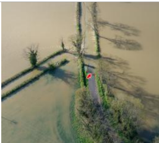
Photo prise pendant l'événement, le 02/04/2024, à 17h52.