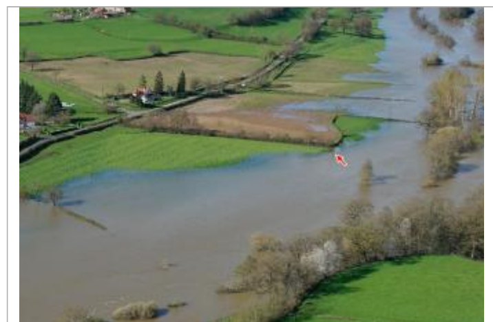
Photo prise pendant l'événement, le 02/04/2024, à 17h04.