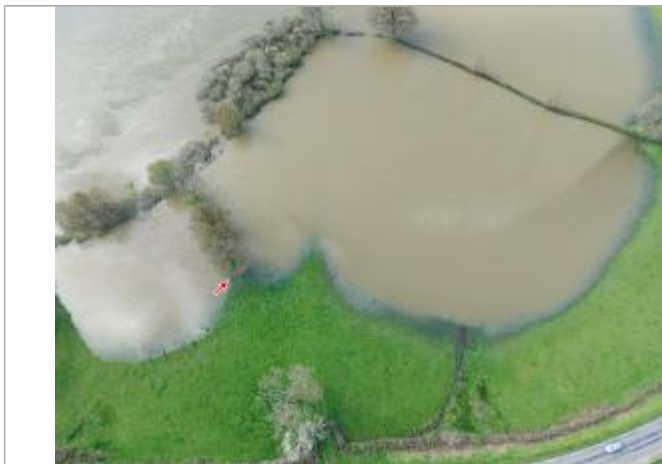
Photo prise pendant l'événement, le 02/04/2024, à 16h53.