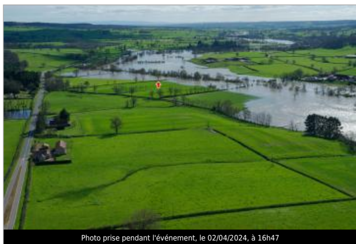
Photo prise pendant l'événement, le 02/04/2024, à 16h47

SOURCE DE REPÉRAGE : SPC LACI, PVA DRONE, L'ARROUX, AVRIL 2024 - 12/08/2024