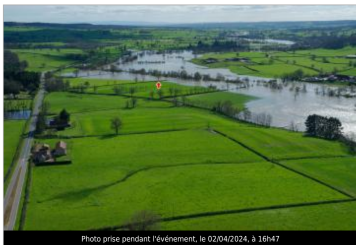
Photo prise pendant l'événement, le 02/04/2024, à 16h47