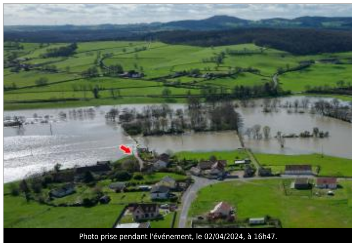
Photo prise pendant l'événement, le 02/04/2024, à 16h47.

SOURCE DE REPÉRAGE : SPC LACI, PVA DRONE, L'ARROUX, AVRIL 2024 - 12/08/2024