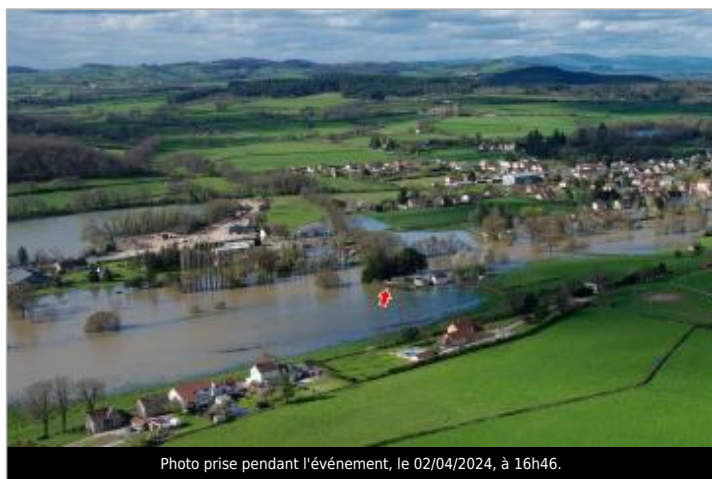
Photo prise pendant l'événement, le 02/04/2024, à 16h46.