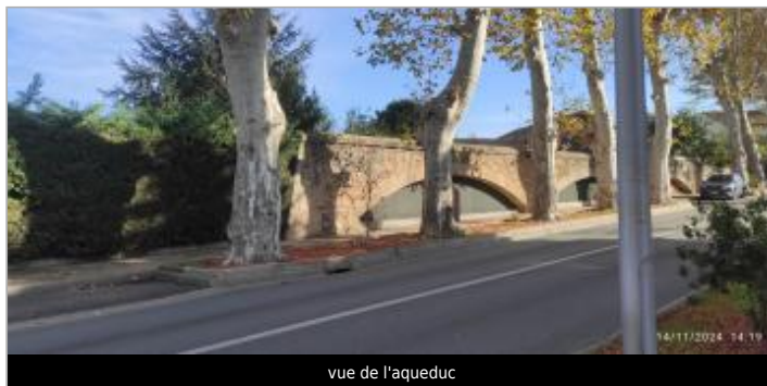
vue de l'aqueduc