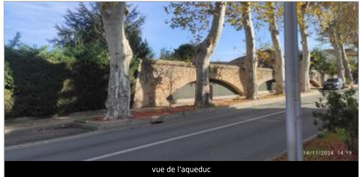
vue de l'aqueduc