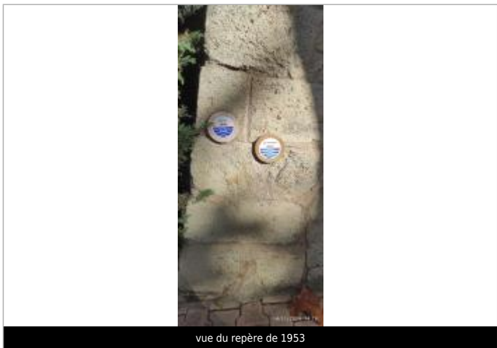
vue du repère de 1953