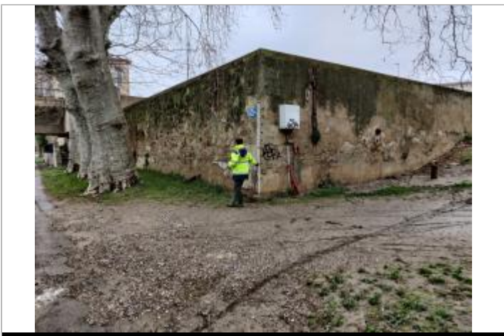
Mur de soutènement

GÉOLOCALISATION Coordonnées WGS84 : X: 3.21337900 / Y: 43.33535770 Coordonnées RGF93 (Lambert 93) X: 717313.9 / Y: 6248491 Coordonnées RGF93 (ETRS89) : X: 3.213379 / Y: 43.3353577 Code Hydro: Y25-0400 Rive de référence: Gauche