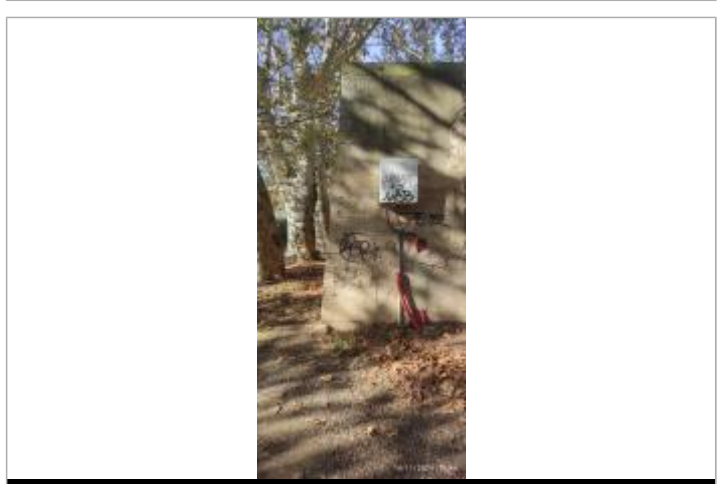
vue des différents repères

MARQUE Texte : 1907 Maximum de l'inondation : Oui Visibilité : Oui État du repère : Moyen Pérennité : Moyenne