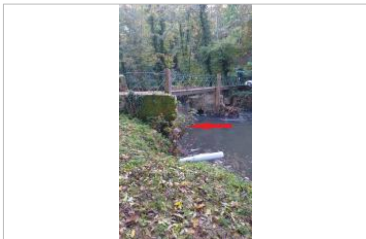
Débris de végétaux sur un arbuste

Altitude calculée de l'eau (en m) : 120.46 m