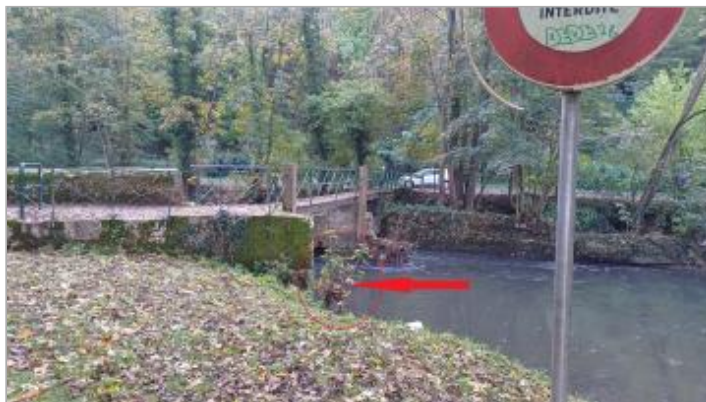
Vue depuis la rive gauche.