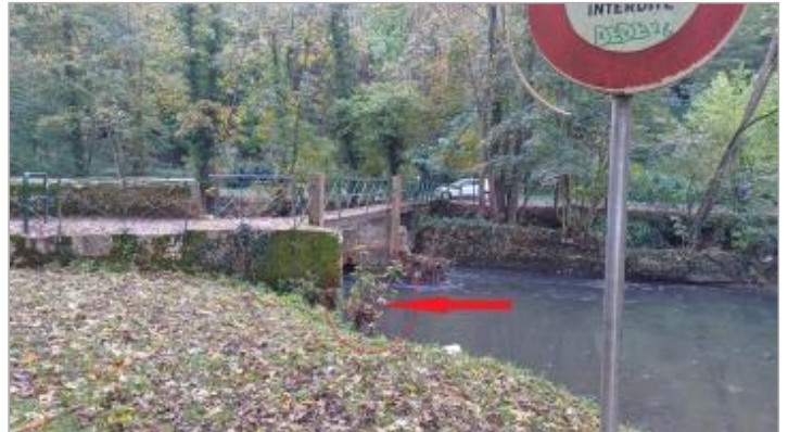
Vue depuis la rive gauche.

Coordonnées WGS84 : X: 1.49187365 / Y: 48.47108540