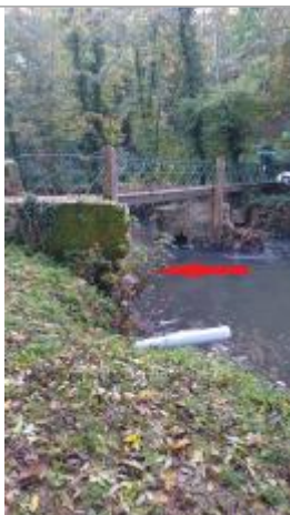
Débris de végétaux sur un arbuste