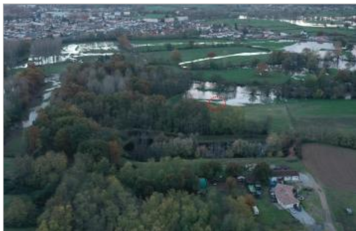
Prise de vue le 15/11/2023 à 18h16