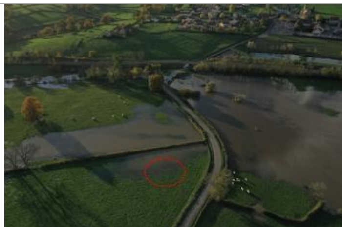
Prise de vue le 15/11/2023 à 17h06