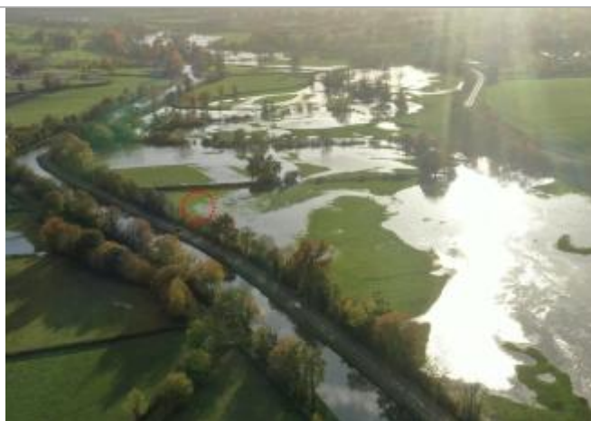
Prise de vue le 15/11/2023 à 16h57

Altitude calculée de l'eau (en m) : 246.25 m