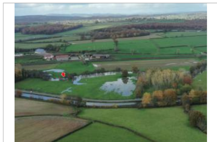
Prise de vue le 15/11/2023 à 14h45