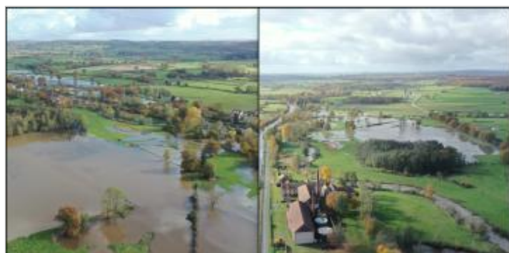
Prise de vue le 15/11/2023 à 14h21 à gauche, et à 14h13 à droite