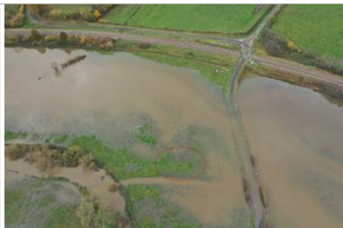
Prise de vue le 15/11/2023 à 12h26

Altitude calculée de l'eau (en m) : 269 m