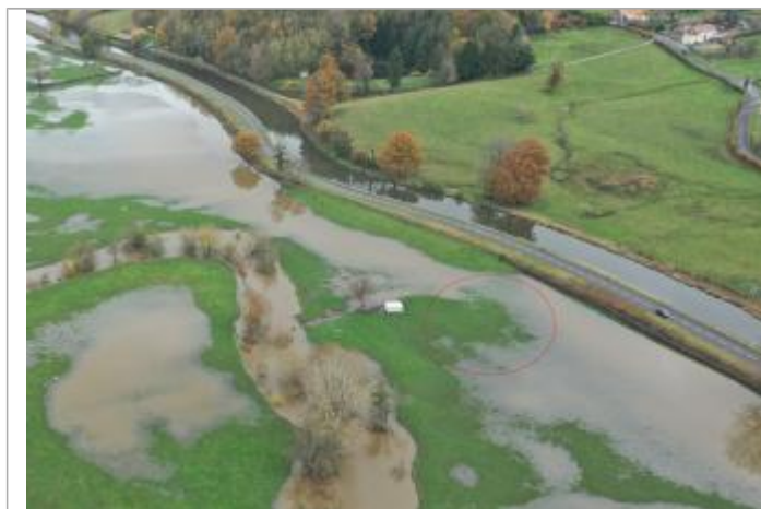
Prise de vue le 15/11/2023 à 12h03

Altitude calculée de l'eau (en m) : 271.9 m