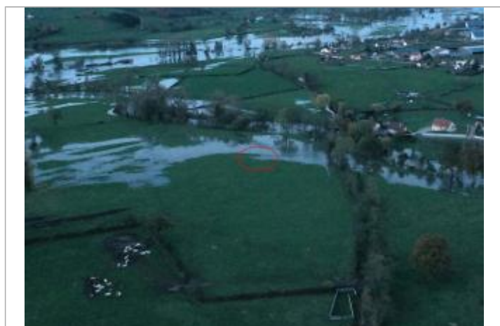
Prise de vue le 15/11/2023 à 18h30