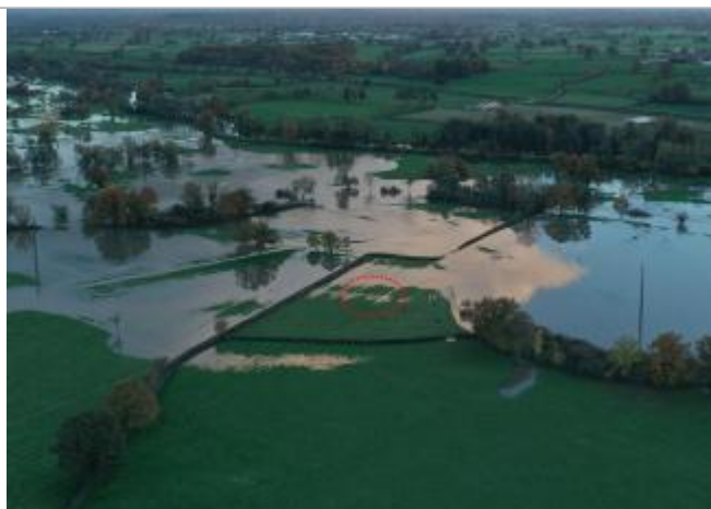
Prise de vue le 15/11/2023 à 18h06

Altitude calculée de l'eau (en m) : 232.15