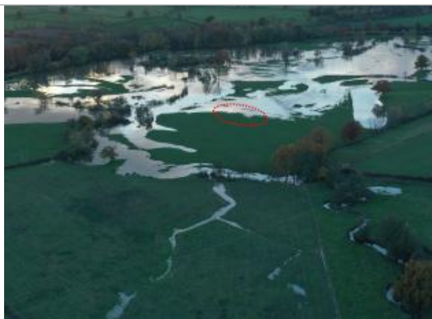
Prise de vue le 15/11/2023 à 17h55

Altitude calculée de l'eau (en m) : 234.8