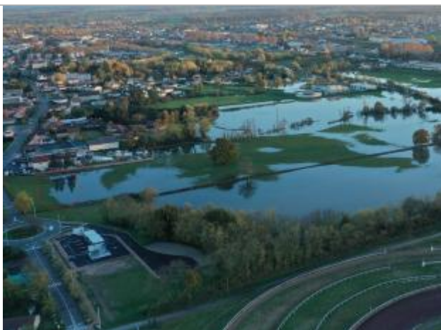
Prise de vue le 15/11/2023 à 17h49

Altitude calculée de l'eau (en m) : 237.3