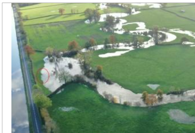
Prise de vue le 15/11/2023 à 16h46