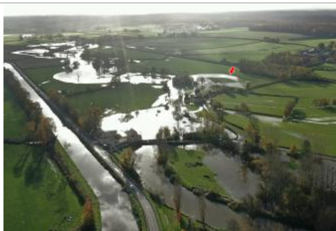
Prise de vue le 15/11/2023 à 16h14