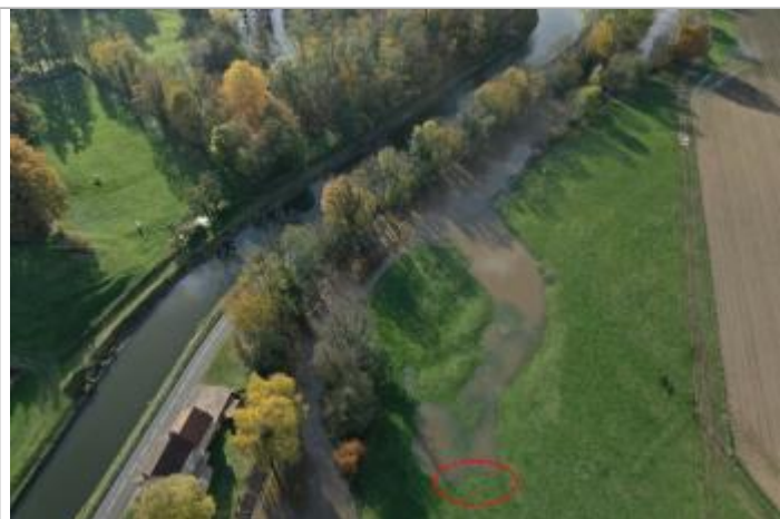
Prise de vue le 15/11/2023 à 15h15

Altitude calculée de l'eau (en m) : 257.4