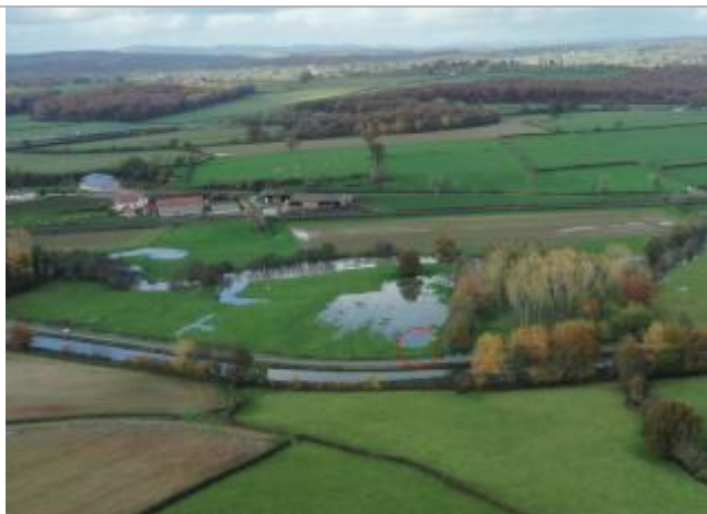
Prise de vue le 15/11/2023 à 14h45