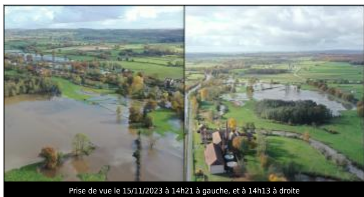
Prise de vue le 15/11/2023 à 14h21 à gauche, et à 14h13 à droite

Code : 24LACIBO1_R_30_1 Date de mise à jour : 18/11/2024 Auteur : SPC LACI