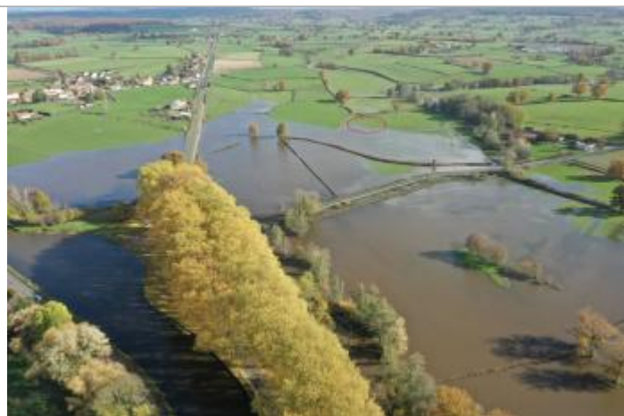
Prise de vue le 15/11/2023 à 14h12

Altitude calculée de l'eau (en m) : 266.5