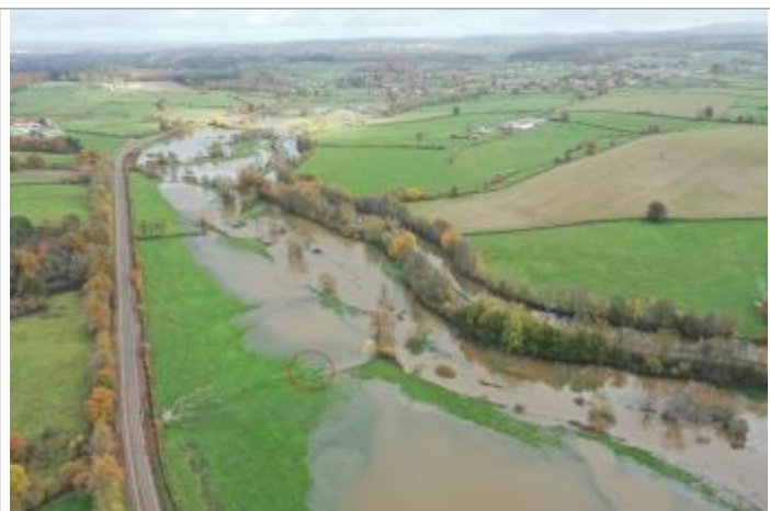
Prise de vue le 15/11/2023 à 12h38

Altitude calculée de l'eau (en m) : 268.3