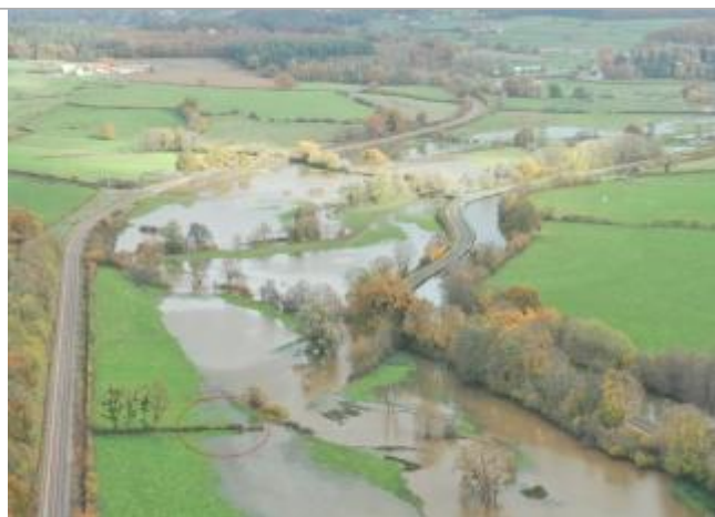
Prise de vue le 15/11/2023 à 12h38

Altitude calculée de l'eau (en m) : 268.4